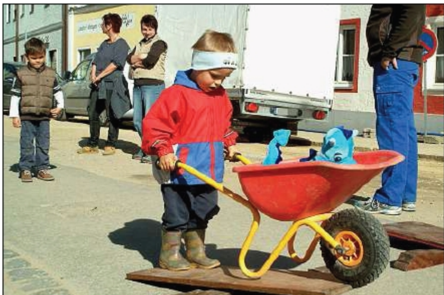
Mit dem Schubkarren über Hindernisse fahren, für diesen kleinen Besucher gar kein Problem.

Hämmern, Kraxln, Schubkarren-Rennen, Bagger fahren – 1. Tanner Baustellenfest wurde zum Erfolg für Groß und Klein