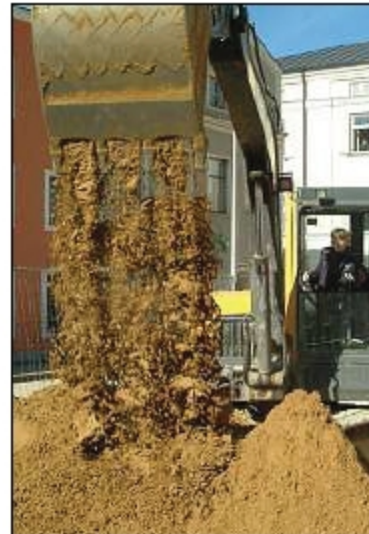
Mit dem Bagger Erdmassen verschieben, machte vor allem den Burschen besonders viel Spaß.