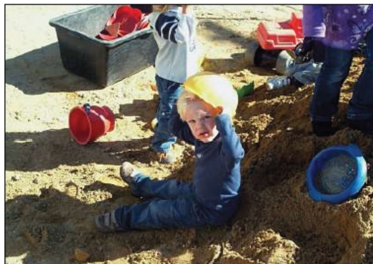
Jede Menge los war auf dem XXL-Sandkasten.